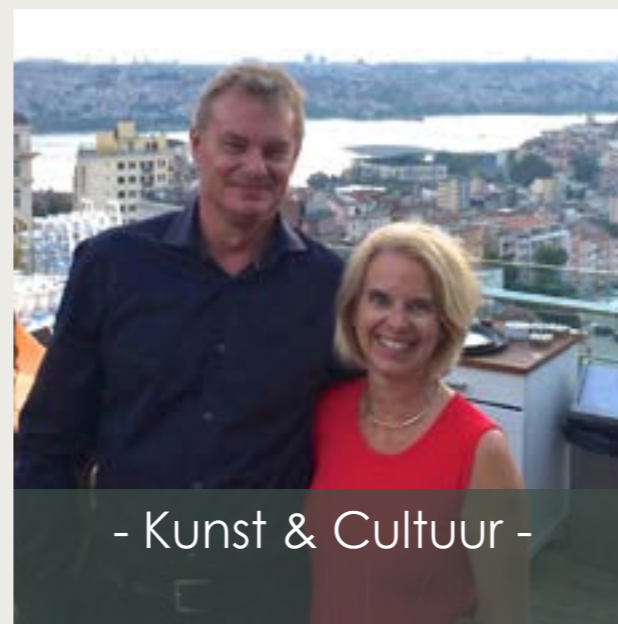
- Kunst & Cultuur -