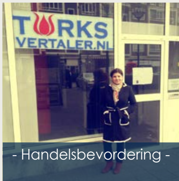
- Handelsbevordering -