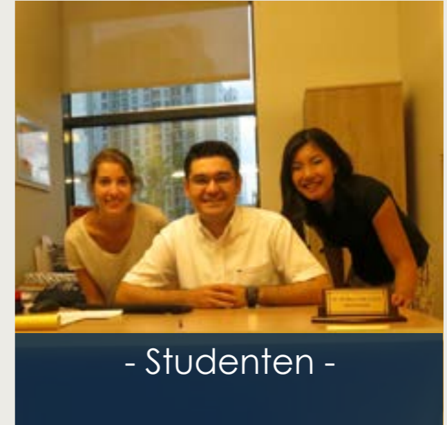
- Studenten -