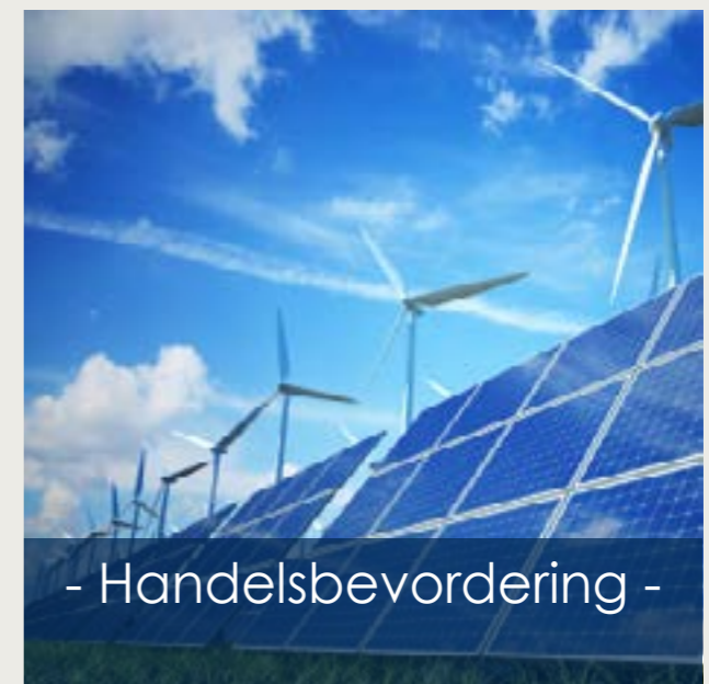
- Handelsbevordering -