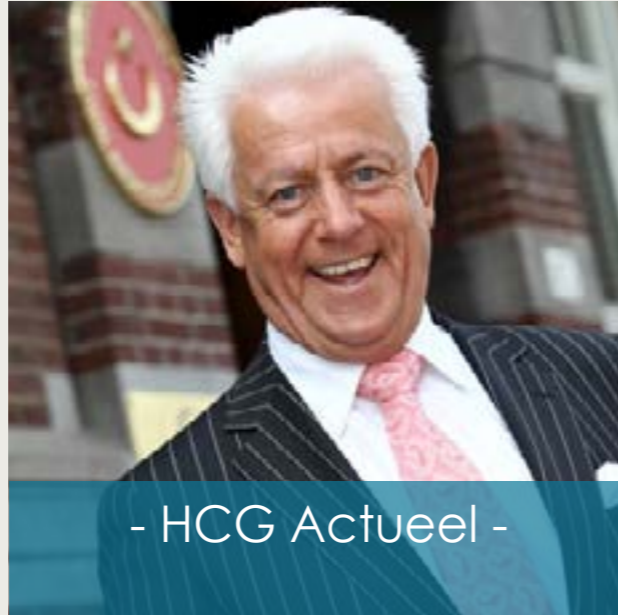
- HCG Actueel -

Children, Baby and Maternity Expo Istanbul