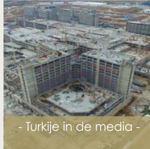
- Turkije in de media -